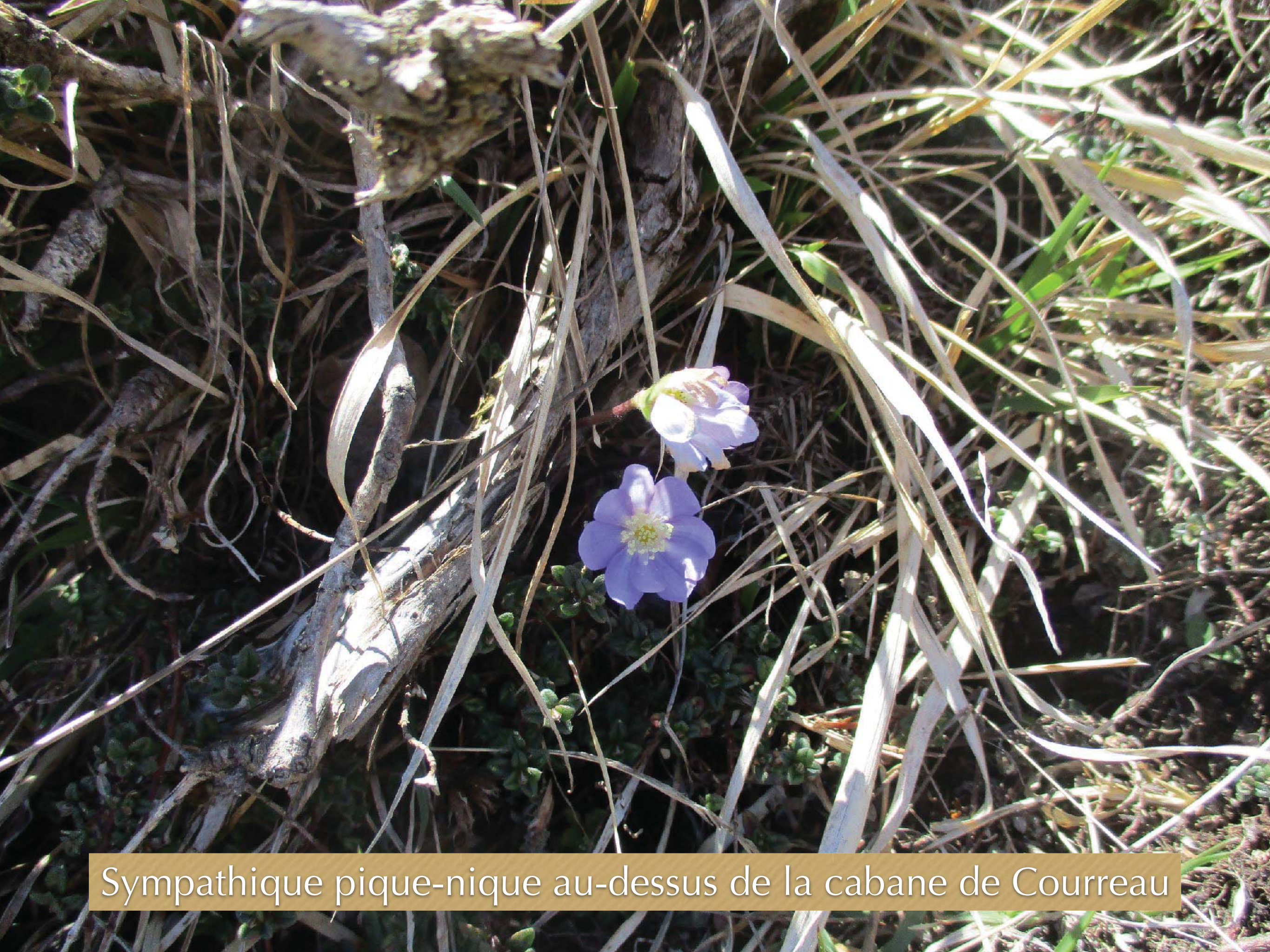
Sympathique pique-nique au-dessus de la cabane de Courreau