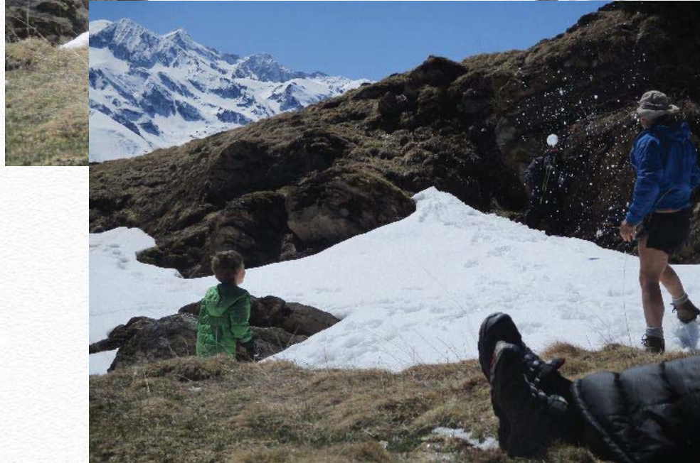
Net avantage des bleu et vert !