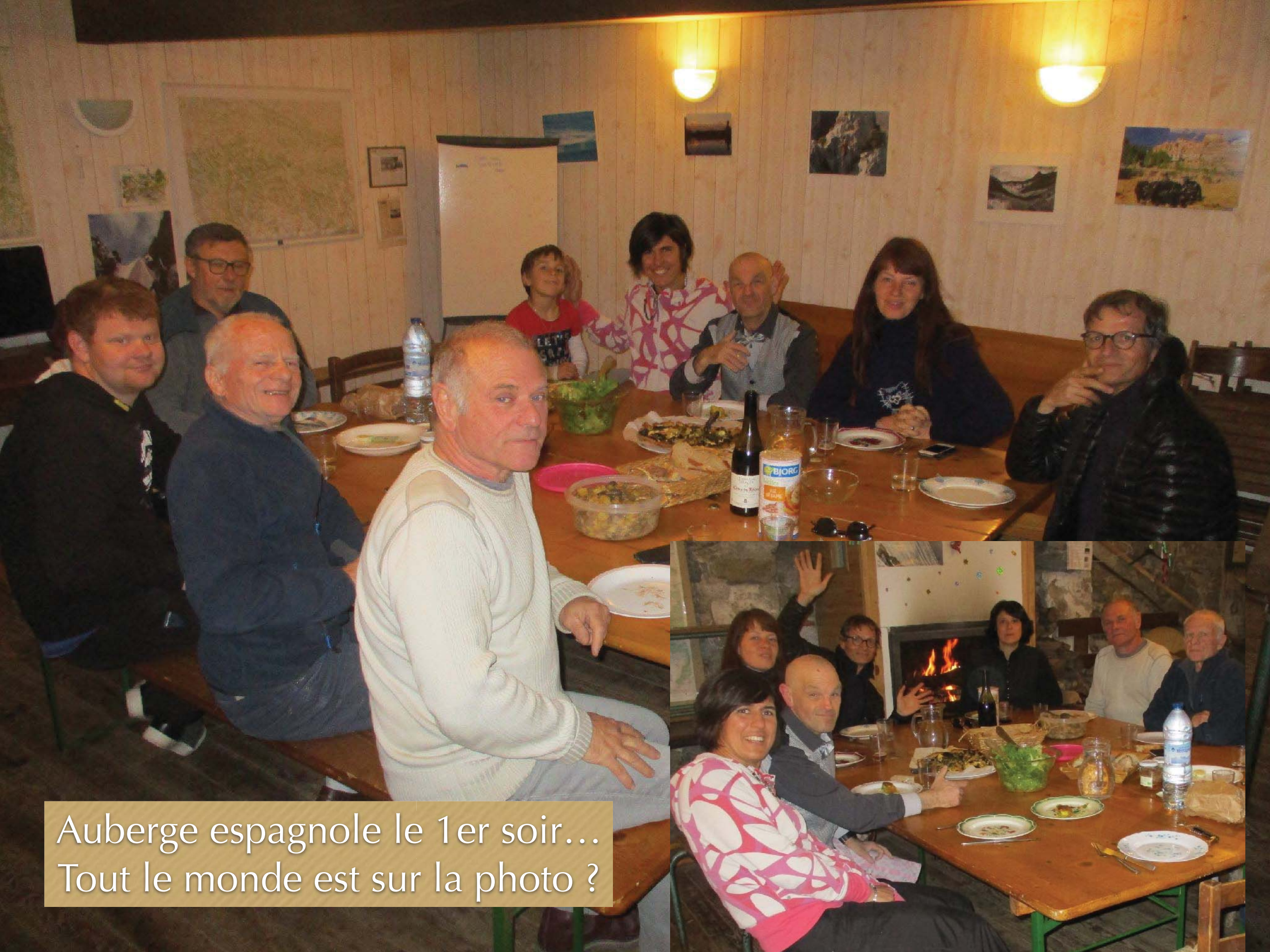
Auberge espagnole le 1er soir... Tout le monde est sur la photo ?