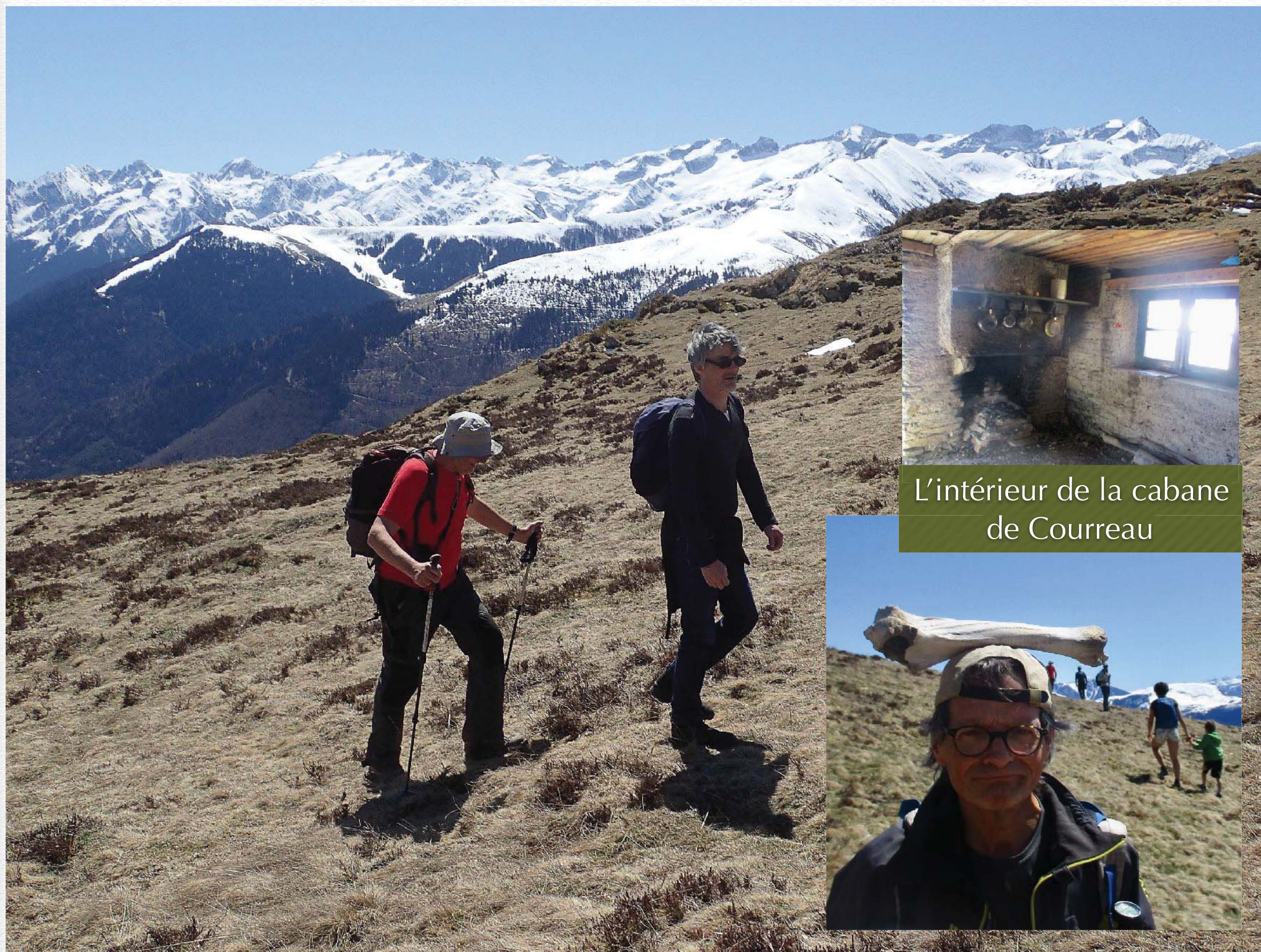
L'intérieur de la cabane de Courreau

L'initiateur rando se transforme en homme paléo l'espace d'un instant